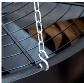
Catene per l'applicazione a soffitto